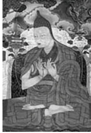
Jamgon Kongtrul (1813-1899)

khác biệt này để mang lại lợi ích cho các hành giả với những nhu cầu khác nhau. Các bậc thầy