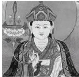
Chogyur Dechen Lingpa (1829-1870)

Rimé hoặc là đã được dạy dỗ theo một truyền thống riêng và qua chứng ngộ của mình, các