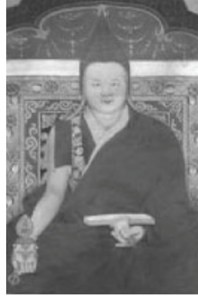
Jamyang Khyentse Wangpo (1820-1892)